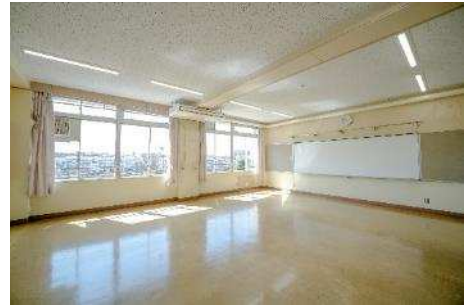
303 レクルーム1 305 レクルーム2