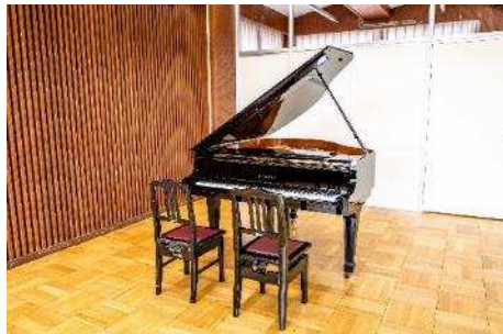
ピアノ (音楽活動室1)