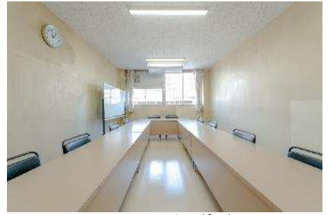
213 会議室1 214 会議室2