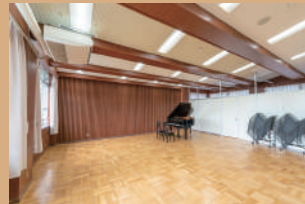
音楽活動室 1 90㎡、定員 50名 ピアノ別料金 (1時間 50円)