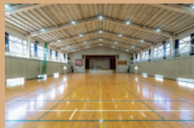
体育館半面 ※バスケ不可 ※必ず室内履きをご用意ください。