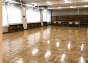
創作活動室 2 120㎡、定員 40名 水道、鏡有