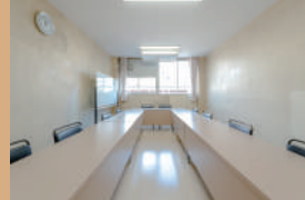
会議室 1・2 30㎡、定員 10名