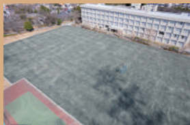
グラウンド半面 9～18時 ※野球不可