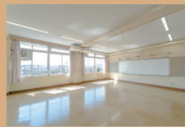
レクルーム 1・2 60㎡、定員 36名