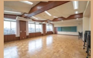
音楽活動室 2 90㎡、定員 50名