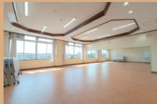
レッスン室 2 60㎡、定員 30名 土足禁止 (2026年6月～)、鏡有