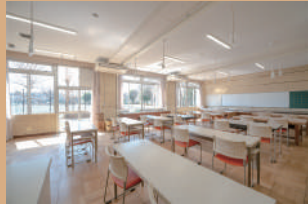
創作活動室 1 90㎡、定員 30名 電動ろくろ有