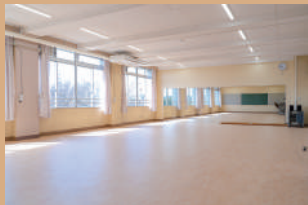
レッスン室 1 120㎡、定員 50名 土足禁止、鏡、音響設備有