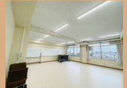
会議室 3 60㎡、定員 30名